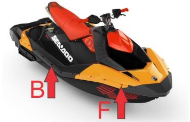
Photo: Exemple, position du boulon à étincelle BRP B - ARRIÈRE Connectez d'abord les vis arrière à la sangle.

Poussez le jet ski en avant et le plus loin possible et fixez les sangles avant.