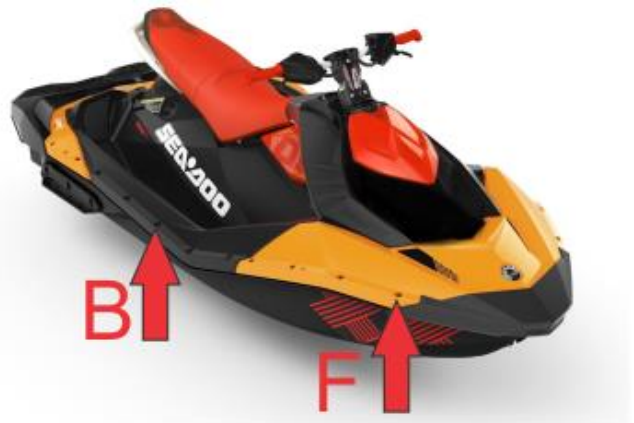
Foto: esempio, BRP Spark fissa la posizione B - BACK

Innanzitutto collegare i bulloni posteriori con la cinghia.